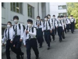
〈初登校 6年後はどんな姿に…〉

入寮が6月だったため、まだ1年間は経っていませんが、皆遅くなりました。もうすぐ後輩が入ってきます。先輩としての立ち振る舞いを期待しています。