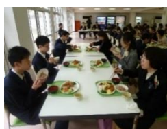
〈3年前の入寮昼食会〉