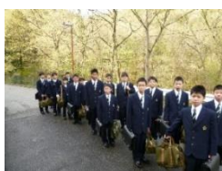
〈6年前の初登校 幼い!〉