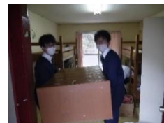
〈片付けも自分たちで〉