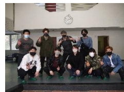
〈昨年度卒業の42期の皆さん〉

毎年、多くの卒業生が来訪するのも寮の特徴です。寝食、苦楽を共にした絆は離れても強く残っています。